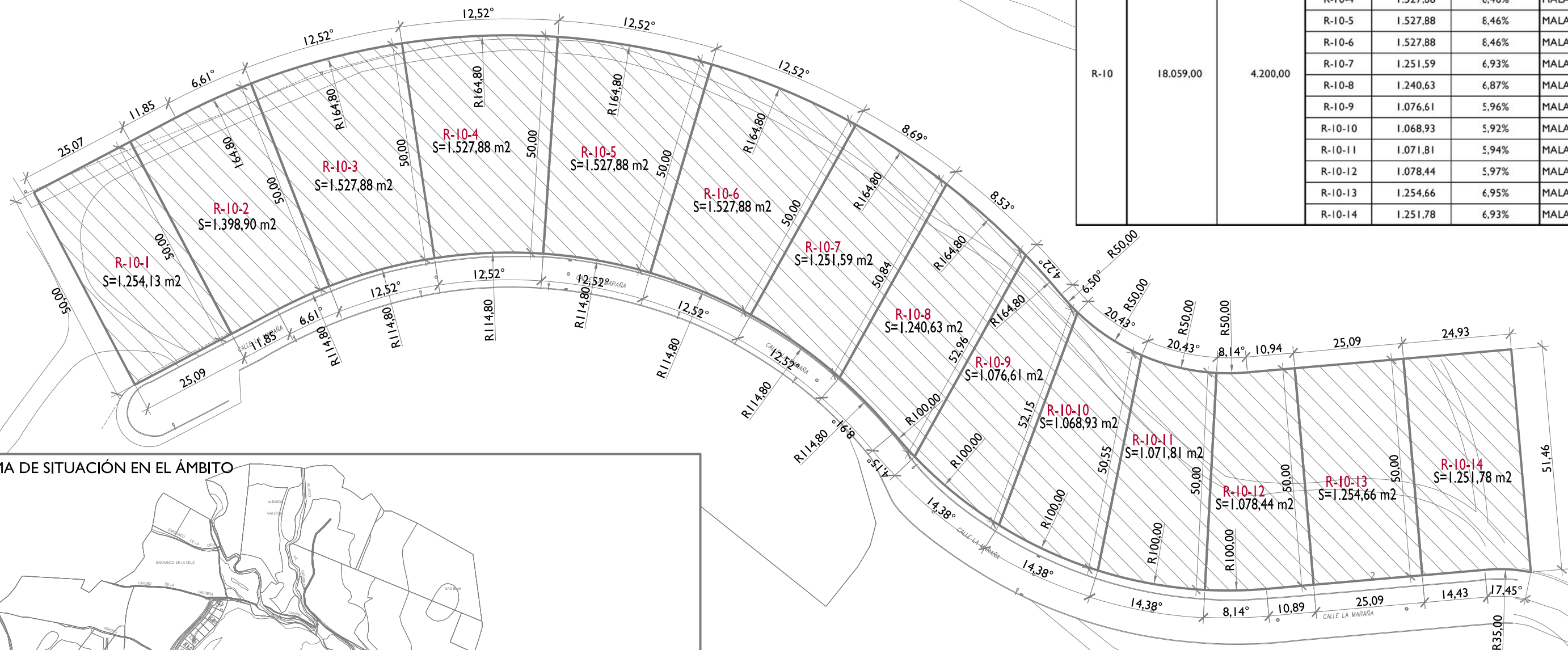
ESQUEMA DE SITUACIÓN EN EL ÁMBITO S/E